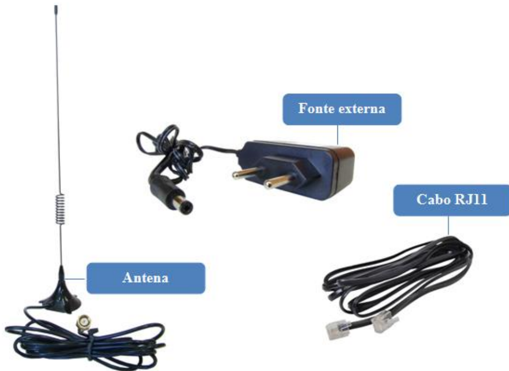
Figura 3 - Antena e fonte externa.