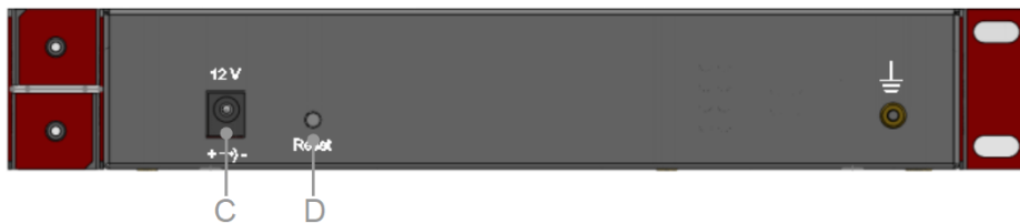
Figura 2 - Traseira do Tokgate S16