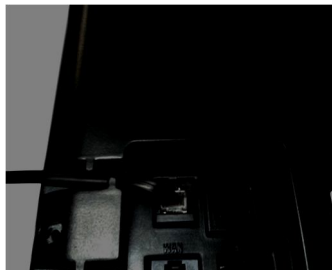
Parte traseira do terminal orbit.go+

A conexão com o ISION utiliza-se do usual cabo telefônico par trançado que tem como função energizar o terminal orbit.go+, bem como prover a comunicação bidirecional entre eles. A figura abaixo ilustra esta conexão que é realizada a partir do conector RJ11 localizado na parte traseira do equipamento.